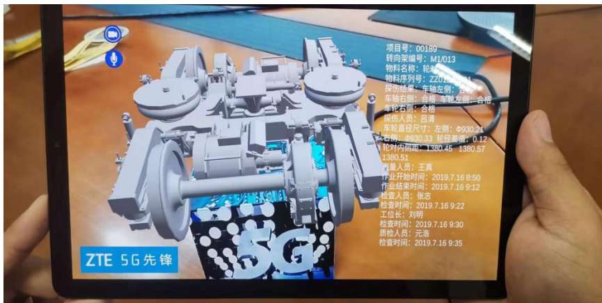
图 3 多人协作